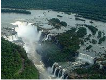
Cataratas del Iguazú, frontera Argentina-Paraguay-Brazil.