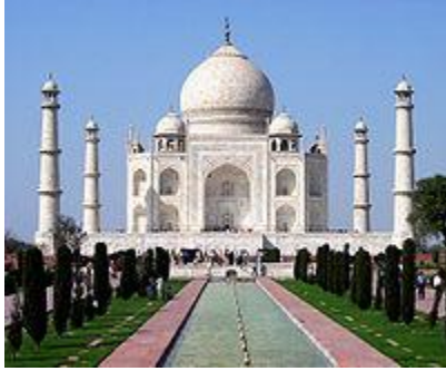
Taj Mahal, Agra, India.