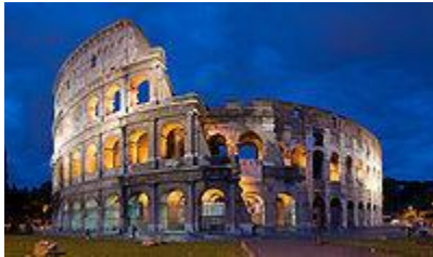
Coliseo, Roma, Italia.