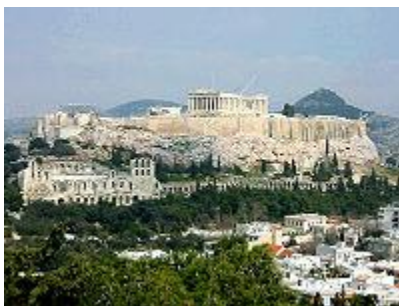
The Acrópolis, Atenas, Grecia.