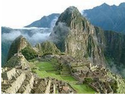
Machu Picchu en Cuzco, Perú.