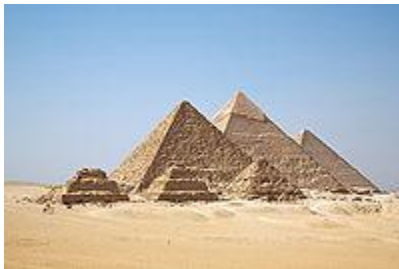
Pirámides de Giza, El Cairo, Egipto.