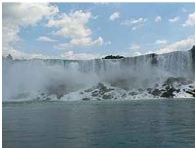
Cataratas del Niágara, frontera Estados Unidos-Canadá.

Es posible afirmar que los viajes de placer tuvieron sus inicios en los últimos años del siglo XVIII y los primeros del XIX. Grandes cambios en la sociedad, en los estilos de vida, en la industria y la tecnología alteraban la morfología de la comunidad. Hay en la historia momentos de cambios excepcionales y de enorme expansión. El siglo XIX fue testigo de una gran expansión económica, seguida de una revolución industrial y científica incluso mayor en la segunda mitad del siglo XX. El turismo fue uno de los principales beneficiarios, para llegar a ser a finales del siglo XX la mayor industria del mundo.