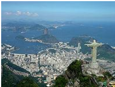
Cristo Redentor, y al fondo la ciudad de Río de Janeiro, Brasil.